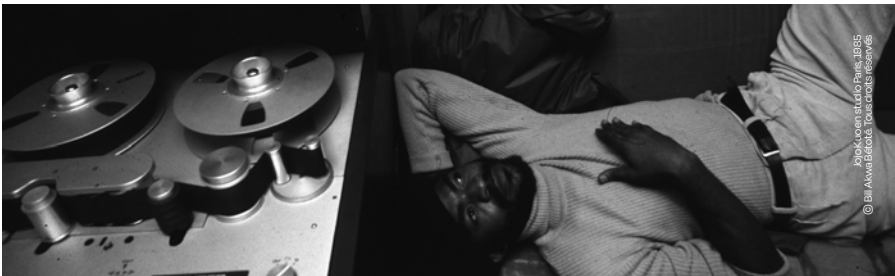
Joyoko en studio Paris, 1985

Biguine Inferno est une biguine expérimentale, un proto zouk où tous ces musiciens laissent libre cours à leur créativité.