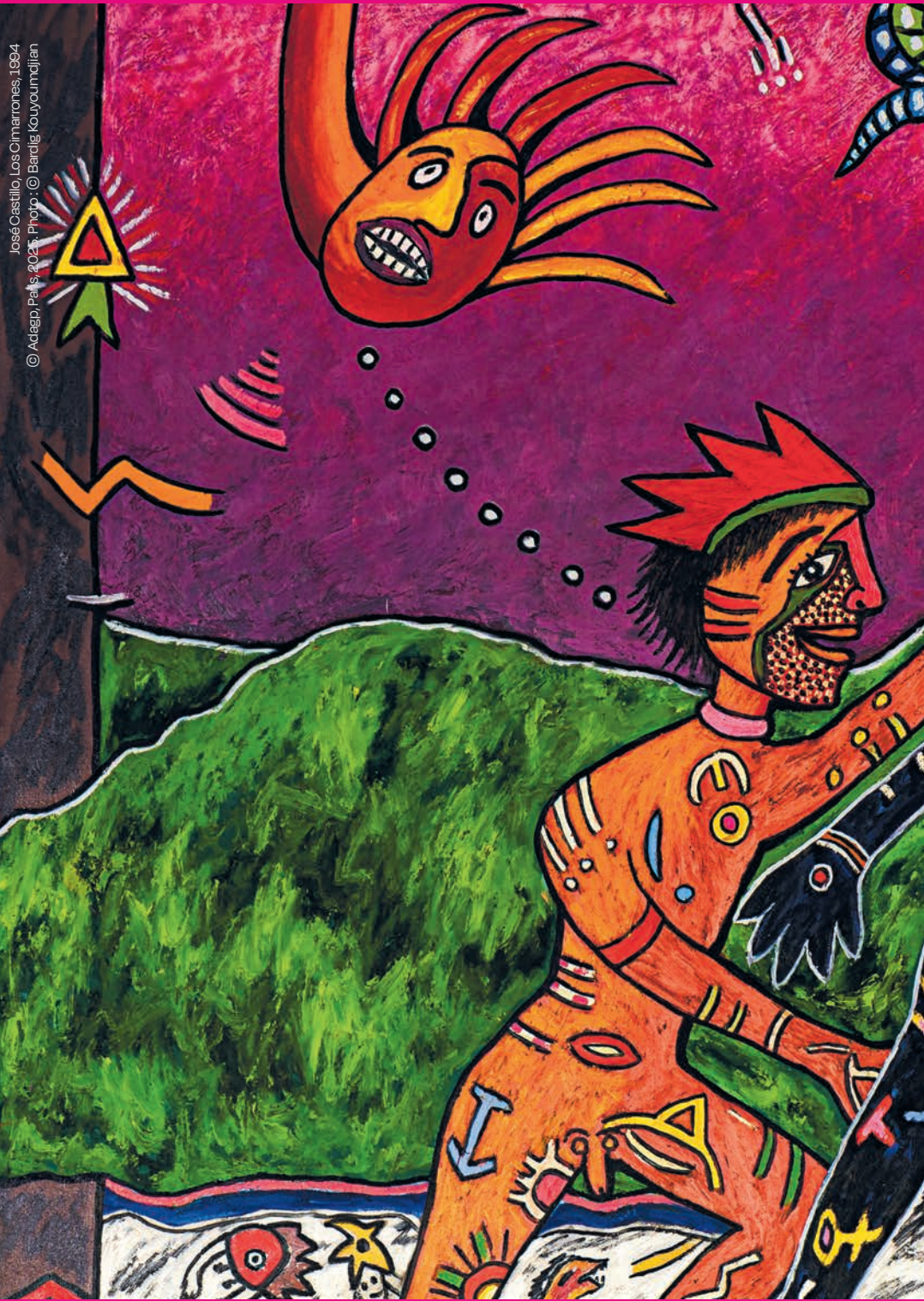
José Castillo, Los Olmarrones, 1994 © Adapp, Paris, 2024.